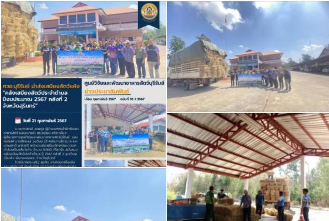
ศวอ.บุรีรัมย์ นำส่งเสบียงสัตว์แห่ง "คลังเสบียงสัตว์ประจำตำบล บึงบประมาณ 2567 คลังที่ 2 จังหวัดสุรินทร์"

🐔🐄🌱🍀 ครอบครัวปศุสัตว์ ทำด้วยใจ ทำให้ไว ทำได้จริง 🌱🐄